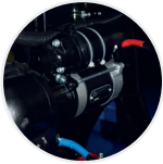
Motor de arranque