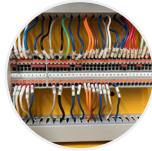
Conexión 2 hilos para inversor fotovoltaico (opcional)