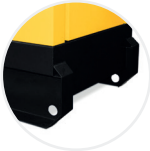
Puntos de arrastre del bastidor