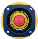
Botón parada de emergencia